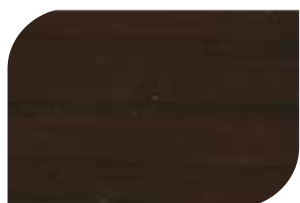
ทับด้วย สีใสด้าน #8000