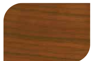
ทับด้วย สีสกัดทอง #8000