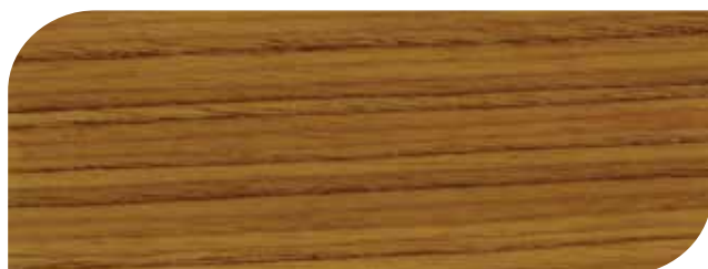
สีใสด้าน - Clear Matt #8000

ให้งานไม้ คงทนสวยงาม ดูเป็นธรรมชาติ เพื่อสร้างความคลาสสิกและ เรียบหรูด้วย สีย้อมไม้ชนิดด้าน