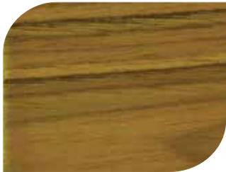
สีสกัดทอง Golden Teak #7901