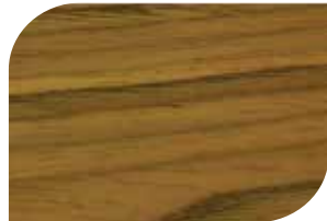
ทับด้วย สีสกัดทอง #8000