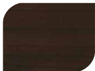
สีม่วงแอมมริสท์ #7912 Amethyst Violet