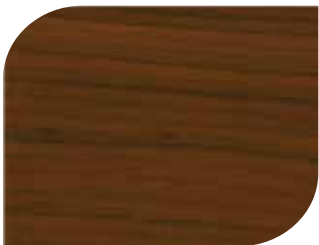
สีประดู่ - Padak #7905