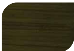
ทับด้วย สีสกัดทอง #8000