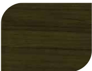
สีเขาสีง - Ebony #7907