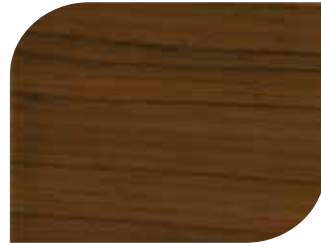
สีมะค่า - Sindora #7902