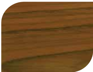
สีสกัด - Teak #7903