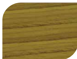
สีใสประกายมุก Pearl Clear #7990