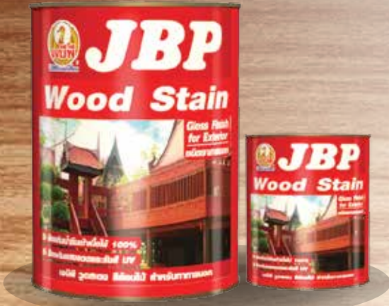
สีย้อมไม้ (ชนิดเงาภายนอก) มีขนาดบรรจุ 1 ลิตร และ 3.785 ลิตร

It is formulated with high quality raw materials. Due to its clear and transparent paint film, it enhances the natural beauty of the wood grain. Provides high gloss and excellent adhesion. Resistant to fungus and mildew growth, paint films prevents water from penetrating in and yet permit entrapped moisture within to escape, thus eliminating the risk of blistering and delamination, it protects and preserves wood and penetrate into the fiber, thus conferring excellent resistance to weathering. The paint system does not employed lead or mercury, it therefore does not pose any hazard to end users. It is suitable for wooden structures, such as sideboard, door, window, furniture and wood work.