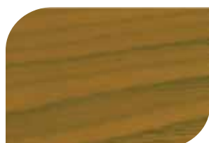
ทับด้วย สีสกัดทอง #8000