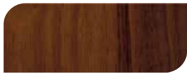
กาสีย้อมไม้ เจบีพี วูดสแตน 3 เที่ยว

แสดงจำนวนเที่ยว ที่ทาบนพื้นผิวไม้โดยใช้สีย้อมไม้