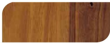
กาสีย้อมไม้ เจบีพี วูดสแตน 2 เที่ยว