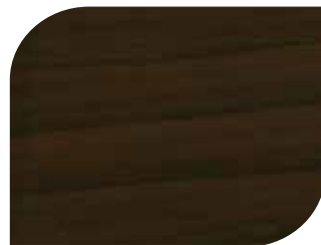
สีวอลนัท - Walnut #7904