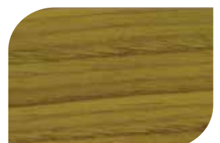
ทับด้วย สีสกัดทอง #8000