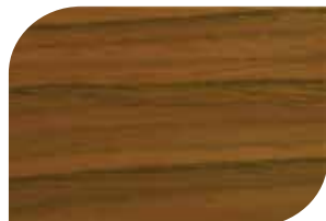
ทับด้วย สีสกัดทอง #8000