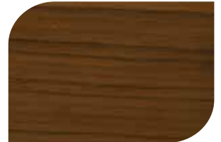
ทับด้วย สีสกัดทอง #8000