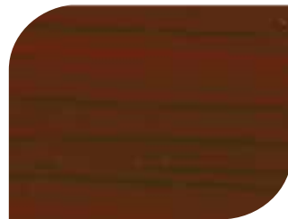
สีแดง - Pyinkado #7906