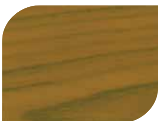
สีเหลืองมรกต Topaz Yellow #7911