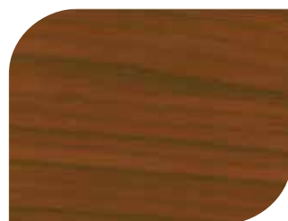
สีมะฮอกกานี Mahogany #7908