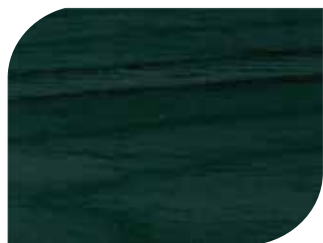
สีน้ำเงินไพบลู #7909 Sapphire Blue