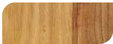
กาสีย้อมไม้ เจบีพี วูดสแตน 1 เที่ยว