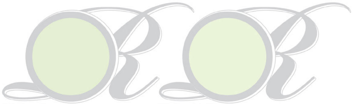
56 Dew Green