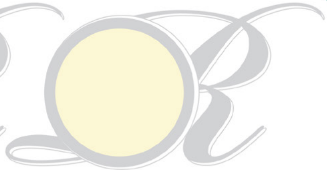
51 Lily Cream