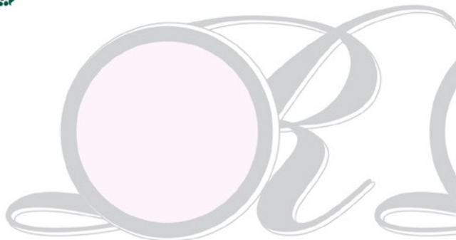
52 Lilac Pink