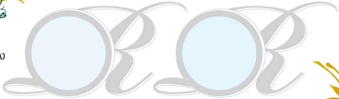
54 Spindrift Sky

Relief เติมพลังให้กับชีวิต กับโทนสีที่ปลอดโปร่ง