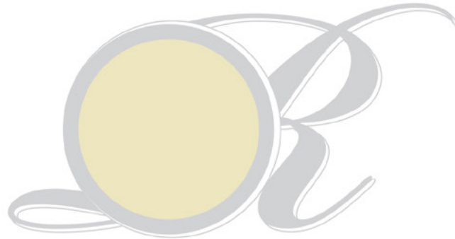
53 Light Brown