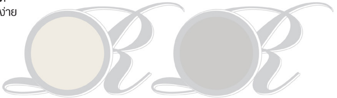
58 Cool White

Rhythm ให้จังหวะกับชีวิต ด้วยโทนสีเรียบง่าย