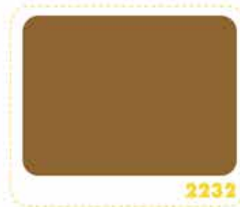
สีเหลืองออกไซด์ OXIDE YELLOW