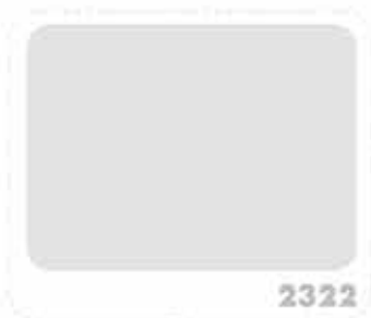
สีเทาหินอ่อน MARBLE GRAY