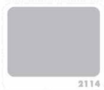
สีบรอนซ์เงิน SILVER