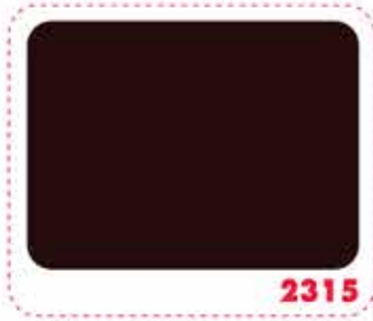
สีน้ำตาล BROWN