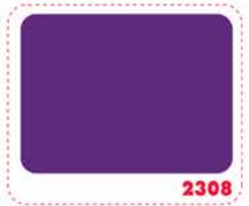
สีม่วงอชุ่น GRAPE VIOLET