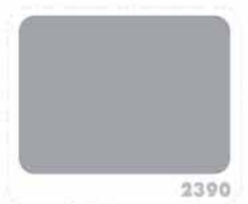
สีเทาน้ำเงิน BLUE GRAY