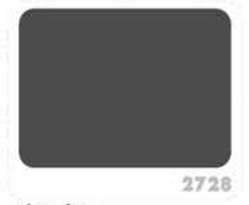
สีเทาดำ BLACK GRAY