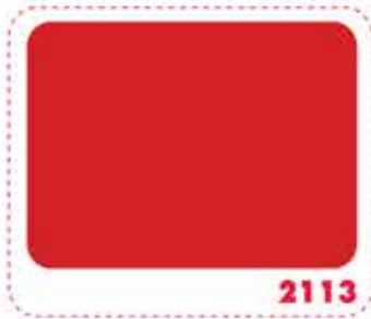
สีแดงซิกแนล SIGNAL RED