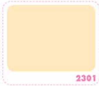
สีเหลืองแพรไหม SILK YELLOW