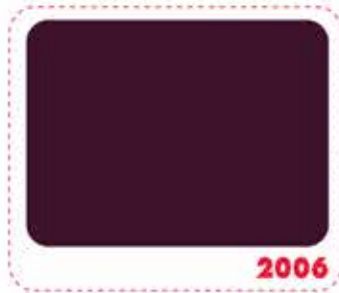
สีแดงมารูน MAROON