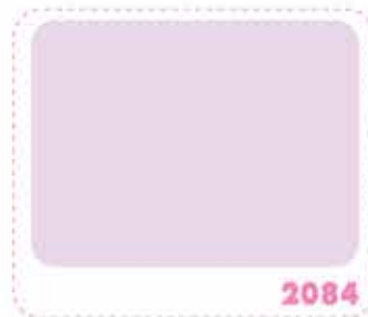
สีม่วงอ่อน LIGHT VIOLET