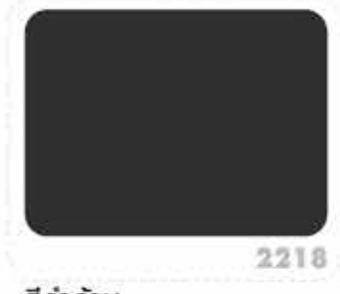
สีดำด้าน FLAT BLACK