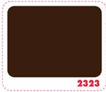
สีน้ำตาลเข้ม DARK BROWN