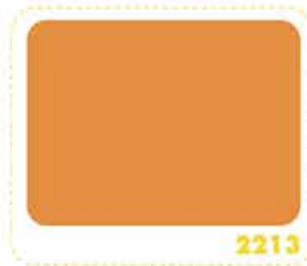
สีเหลืองส้ม ORANGE YELLOW