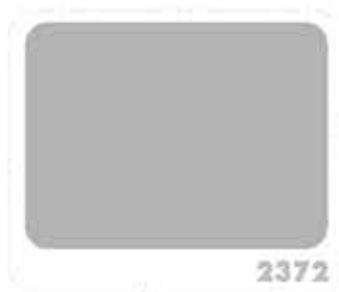
สีควันบุหรี่ SMOKY