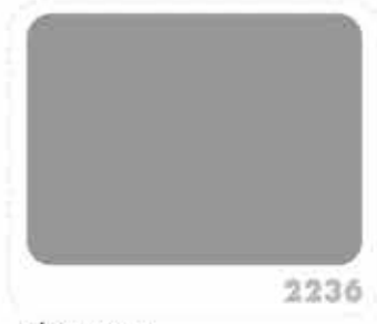
สีเทากฎา MOUNTAIN GRAY