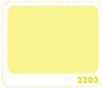
สีเหลืองนาร์ซิส NARCISSUS YELLOW