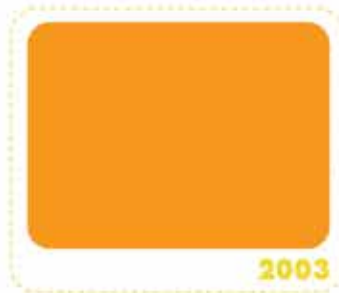
สีเหลืองทอง GOLDEN YELLOW