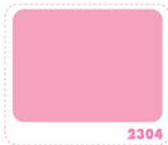
สีชมพูทอแสง DAWN PINK