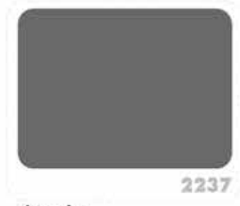
สีเทาเข้ม DEEP GRAY